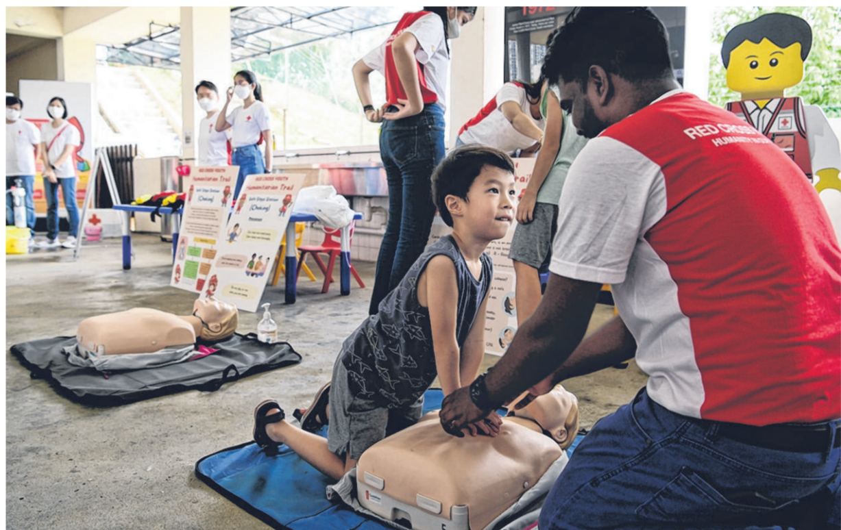
附近的居民和小孩在红十字青年协会庆祝成立70周年的活动上，向红十字会的义工学习紧急救援知识和技能。

新加坡红十字会秘书长兼首席执行官班杰明·威廉(Benjamin William)致辞时说，红十字青年协会向来与时俱进，接下来也会继续做出调整，协助年轻人更好的应对未来的各种挑战。