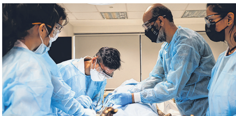
为提高国人对遗体捐献的意识，杨潞龄医学院在2012年推出“无语良师”计划。

为提高国人对遗体捐献的意识，杨潞龄医学院在2012年推出“无语良师”(Silent Mentor Programme)。这项计划今年迈入第10年，截至8月23日，共接收到174具遗体，当中106个男性，68个女性，年龄介于38岁至98岁。这些遗体捐献者都是生前向NOTU注册，死后由家属送交国大医学院作为教学用途，因此被称为“无语良师”。